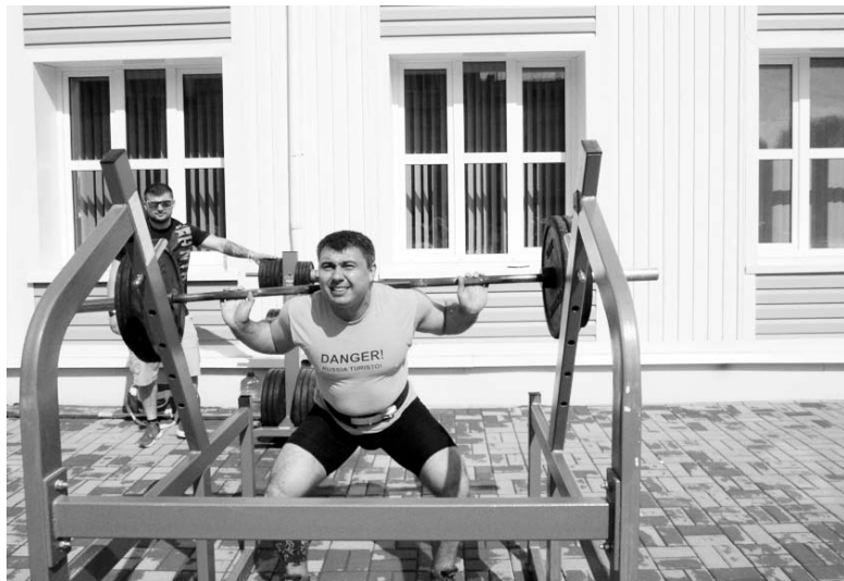
Соревнования по жиму.