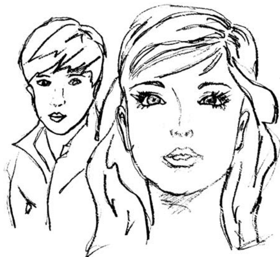
Выпуск № 5