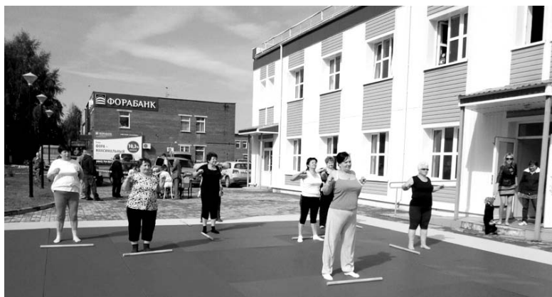
Выступление секции ОФП «Бабушки».